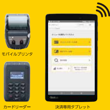
モバイルプリンタ